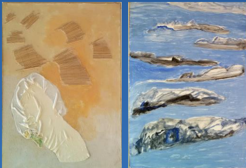
Grabstelen als Doppelbilder Installation: Material- und Farbcollagen